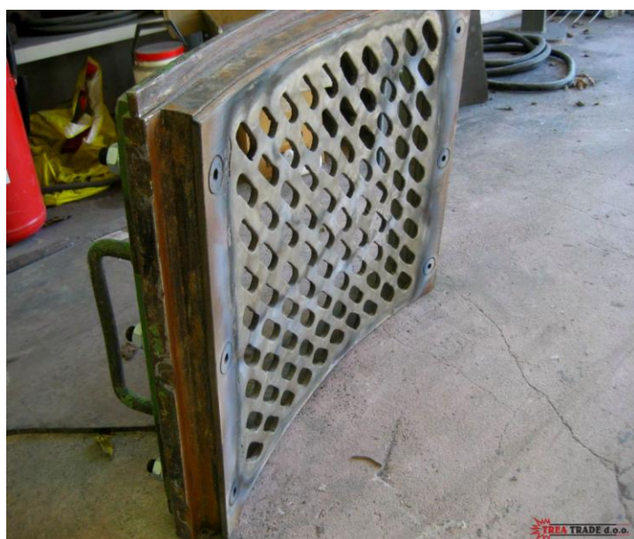
Naštrcavanje na toplo sita drobilice