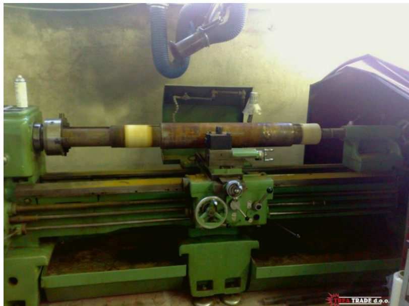
Naštrcavanje na hladno dosjeda ležaja