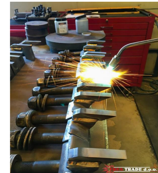
Naštrcavanje na toplo noževa mlina