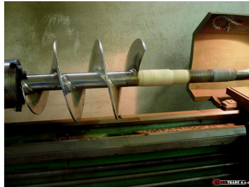
Naštrcavanje na hladno dosjeda ležaja