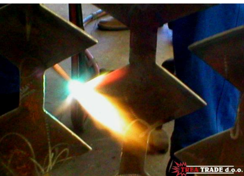
Naštrcavanje na toplo presipa