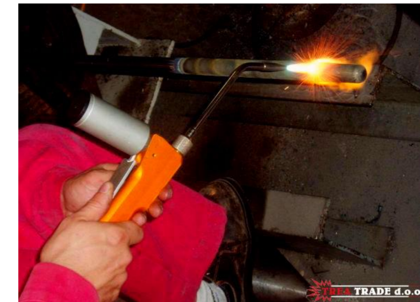
Naštrcavanje na toplo zaštitnih polucijevi senzora temperature