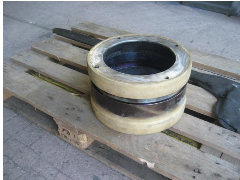
Naštrcavanje na hladno klipova kompresora (sivi lijev)