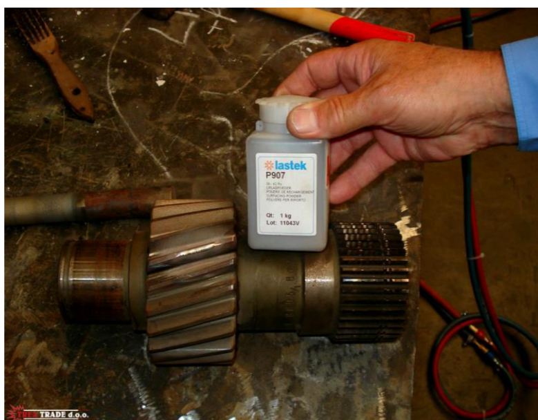
Naštrcavanje na toplo oštećenja zuba zupčanika