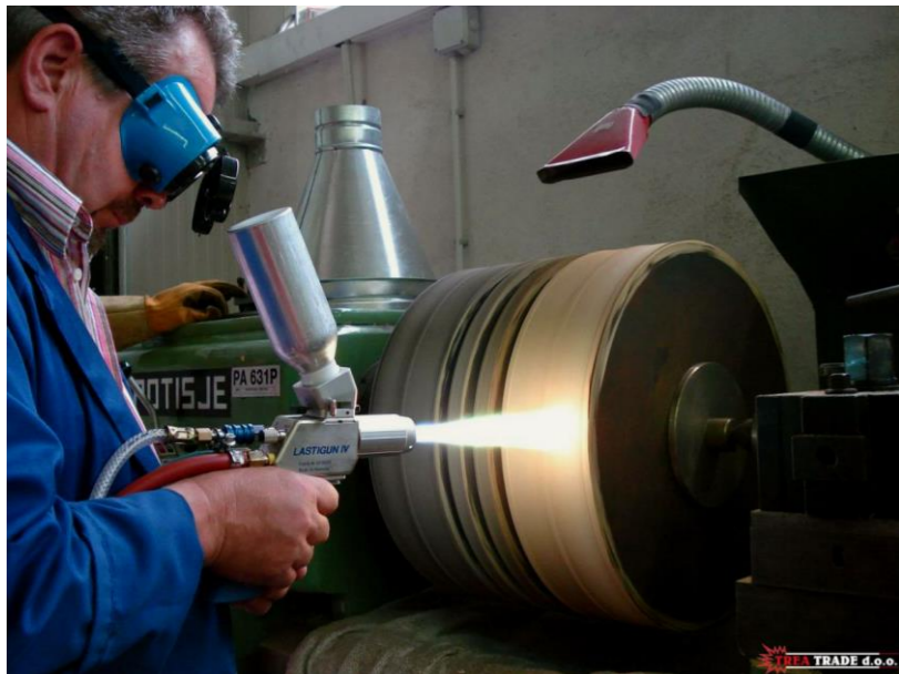
Naštrcavanje na hladno klipova kompresora (sivi lijev)