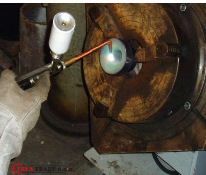
Naštrcavanje na toplo užnice