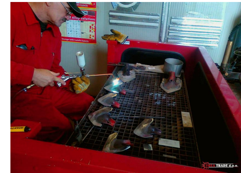
Naštrcavanje na toplo motičica kultivatora