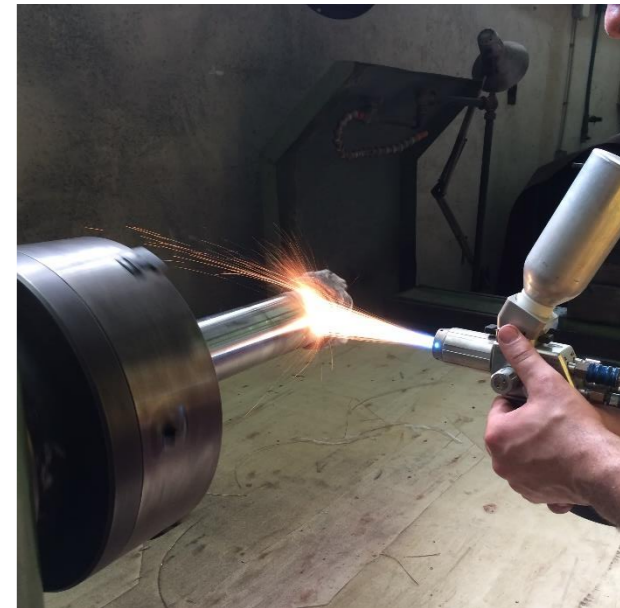
Naštrcavanje na hladno dosjeda ležaja